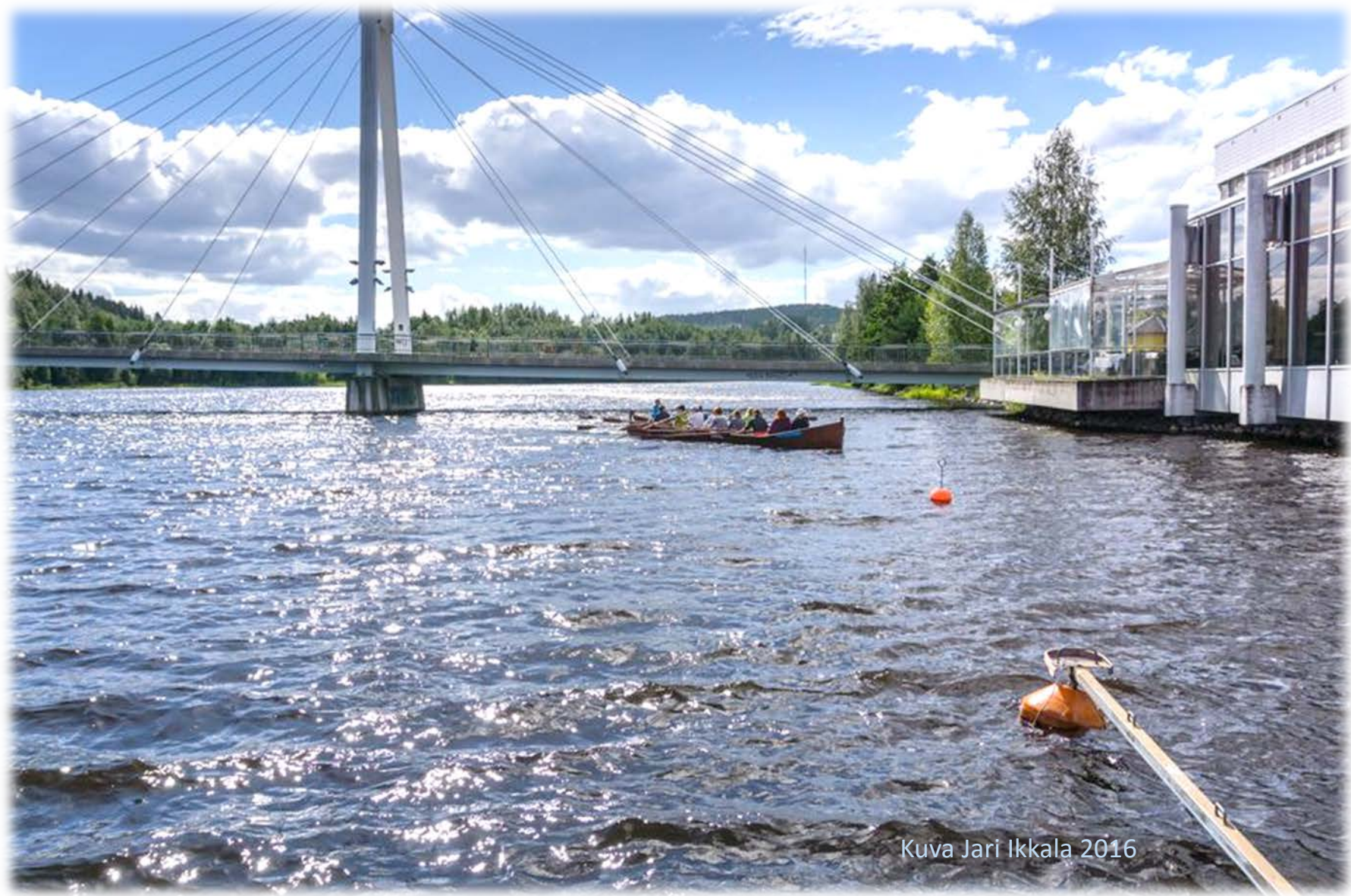
Kuva Jari Ikkala 2016